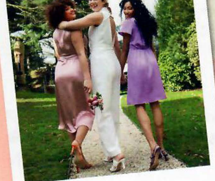
De jump wagen LolaLiza, 99,99 euro