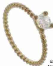
Ring Supermom adviesprijs: 325 euro supermomantwerp.com