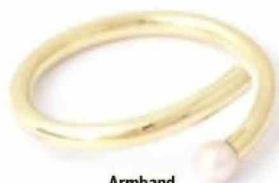
Armband Elisa Lee adviesprijs: 1400 euro elisa-lee.be